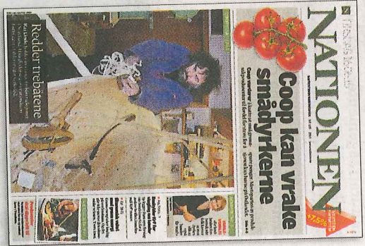
Nationer: Papir best i sollys.

Planene for Nationen og andre aviser er overgang til elektroniske «plattform». Det er en hake med disse plattformene, jeg kan ikke lese avisen på PC i sollys, og jeg kan ikke løse avisas sudoku på PC. Så da får jeg ikke mer kosi i morgensol når de morderne plattformene tar over. Redaksjonen har kanskje tenkt ut en løsning for meg?