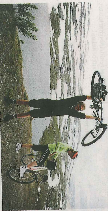
Fjell: Fjellområdene er en attraktiv arena for mange nye former for friluftsliv, blant annet sykling og topppturer, skriver innsenderne.

Alle medlemmer i styret for fjell-forsk-nett